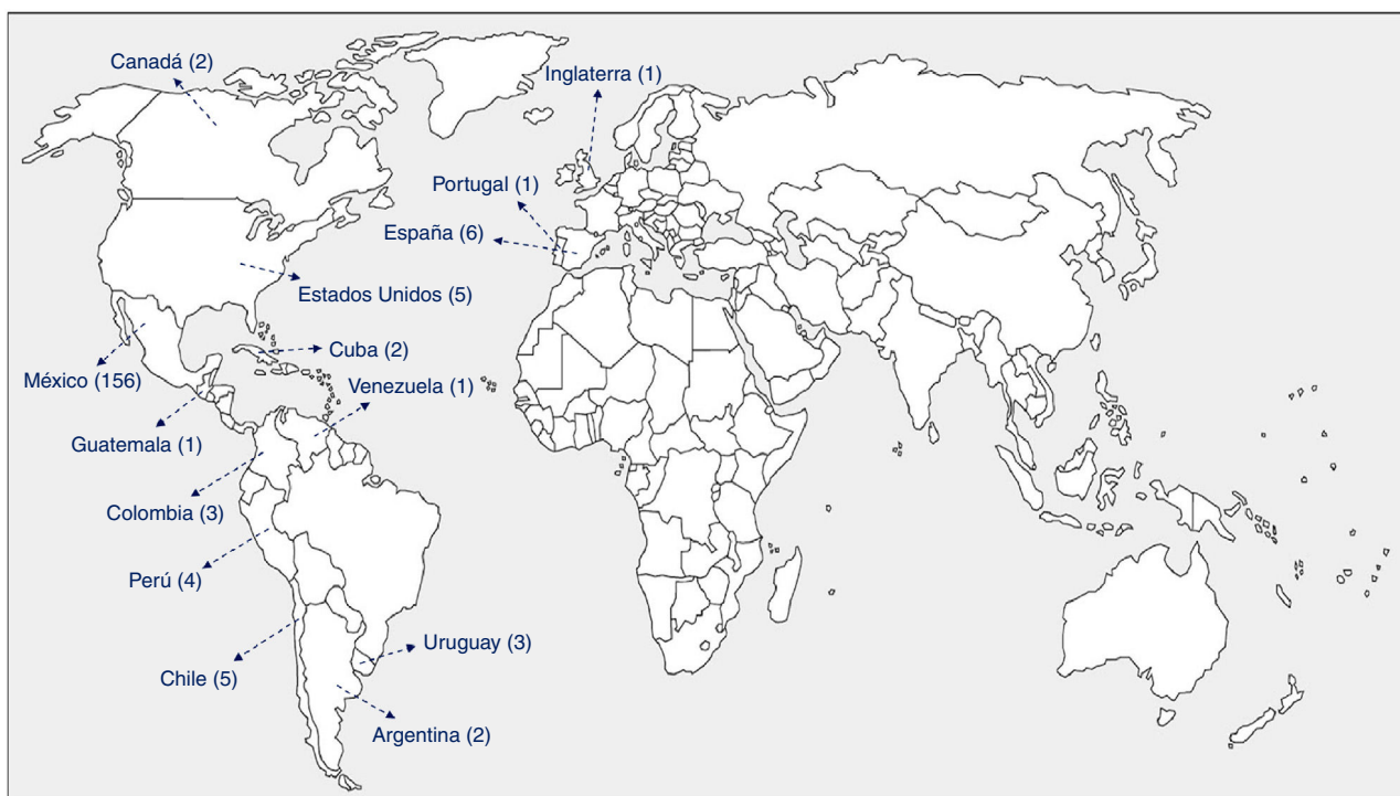
Figura 1 Afiliación de los autores.

Nota: se excluyeron los trabajos publicados en las secciones «NECS» y «Resúmenes».