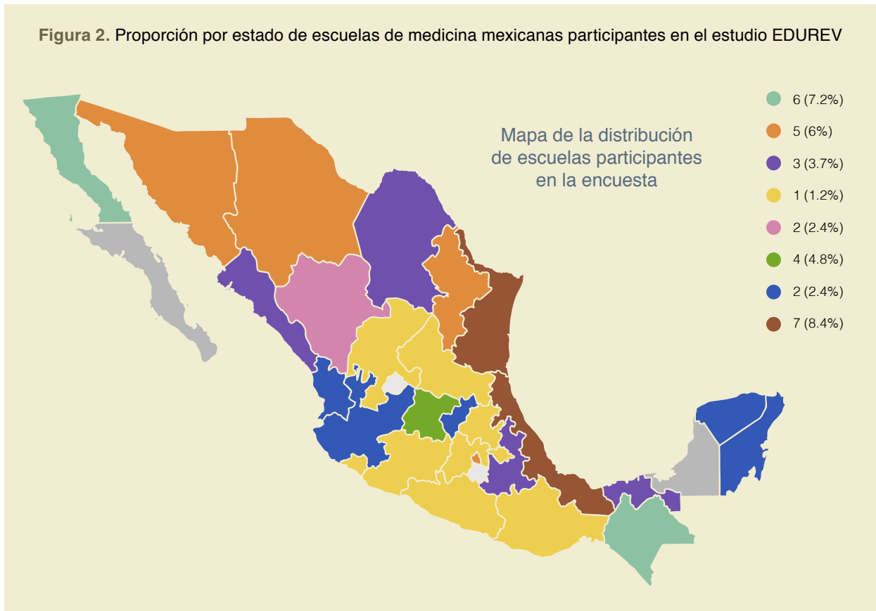
Figura 2. Proporción por estado de escuelas de medicina mexicanas participantes en el estudio EDUREV

no se identificó una causa por la cual no ha sido incluido en el currículum.