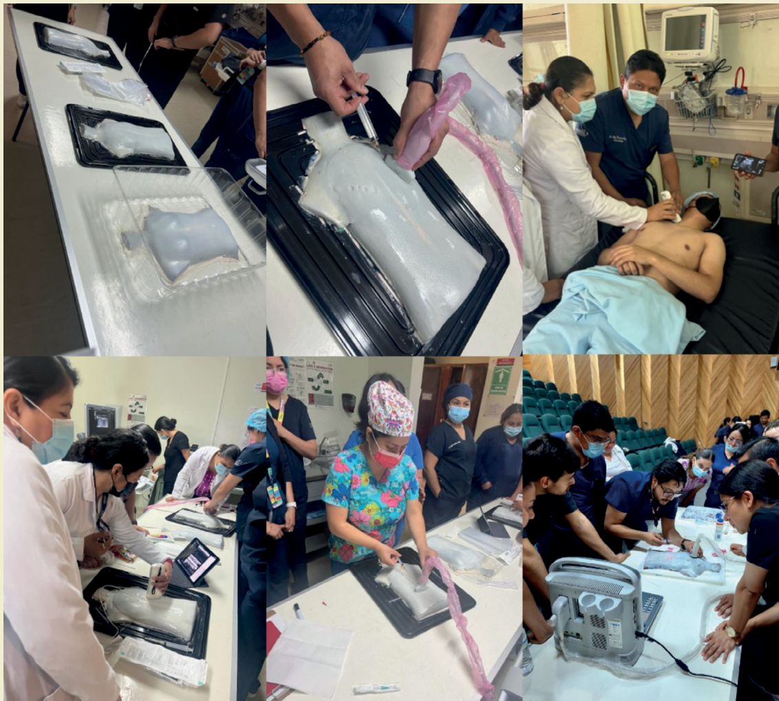
Figura 1. Estaciones de simulación con el modelo de bajo costo para inserción de catéteres venosos centrales por técnica ecoguiada

se veía competente, aunque un 24.2% no se sentía familiarizado con esta técnica. En términos de la confianza para la realización de la técnica, un 51.5% se sentía seguro, un 18.2% totalmente seguro, mientras que otro 18.2% admitió tener poca confianza, como se observa en la tabla 1 .