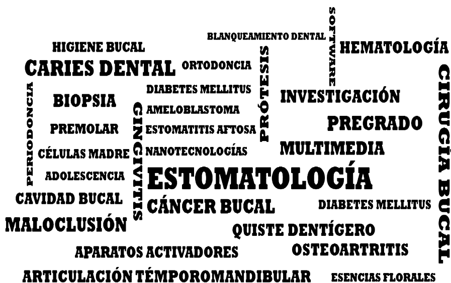
Figura 2 Nube de palabras clave utilizadas en las investigaciones.

Es válido señalar que la participación está centrada fundamentalmente en los estudiantes de cuarto año de la carrera (32.35%). Ello pudiera estar relacionado con un acceso tardío al mundo de la investigación dentro de las