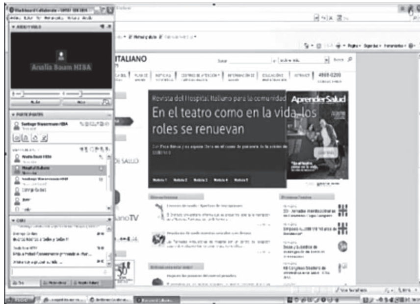
Figura 3. Captura de pantalla del primer encuentro sincrónico.