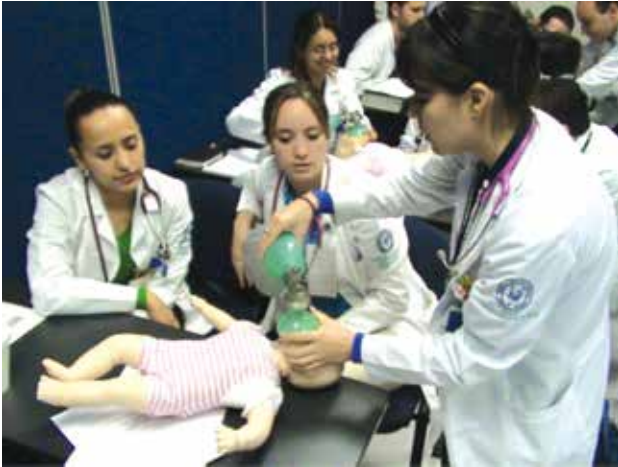
Figura 3. Escenario de la sesión de “cómo enseñar un procedimiento psicomotriz” del Taller “El Médico Residente como Educador”, de la Facultad de Medicina de la UNAM.

internos, estudiantes de medicina y enfermeras, y no suele recibir instrucción formal para el desarrollo de competencias docentes.