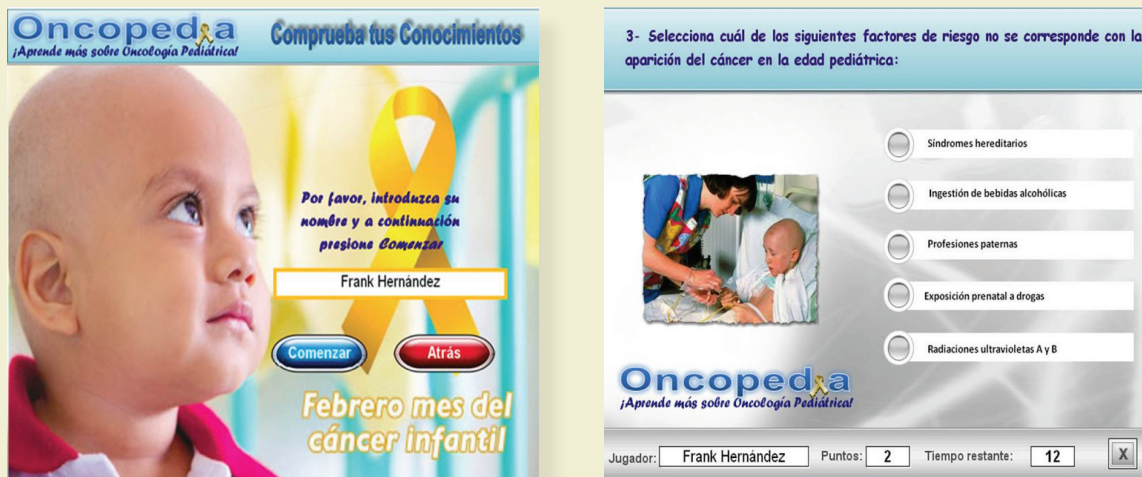
Figura 3. Módulo Comprueba tus conocimientos del software educativo “Oncopedia”

conocer las localizaciones más frecuentes de los procesos malignos en la infancia, y sus características.