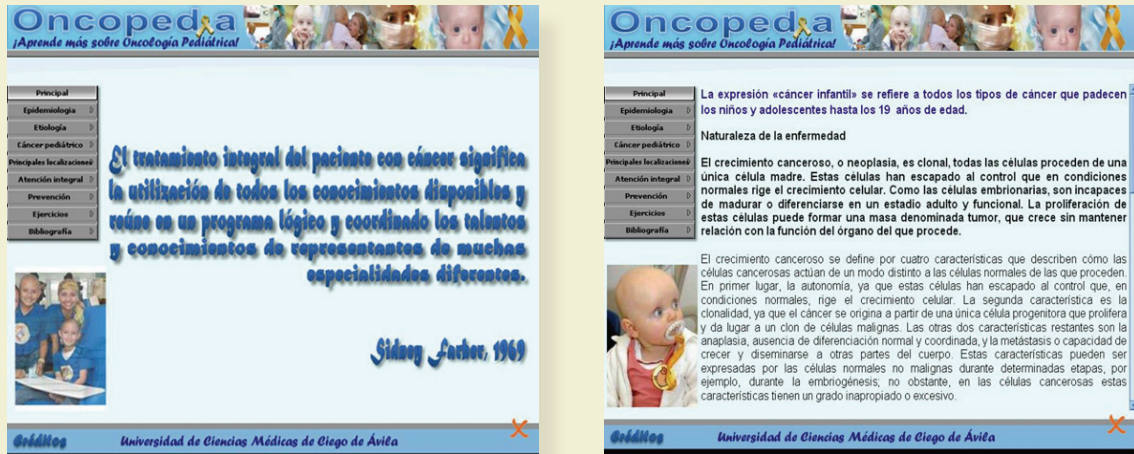
Figura 2. Páginas de contenido del software educativo “Oncopedia”