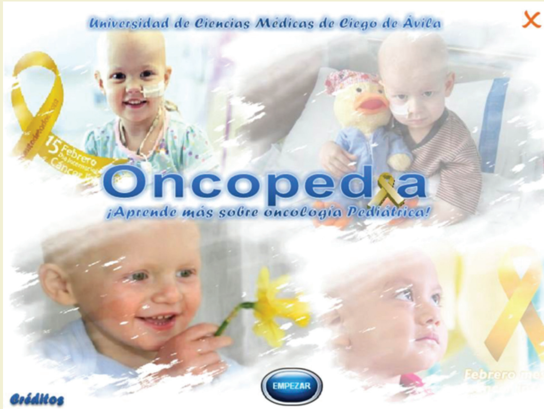
Figura 1. Página de inicio del software educativo "Oncopedia"